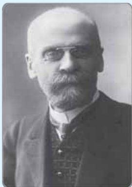
(امیل دورکیم زاده ۱۵ آوریل ۱۸۵۸ درگذشته ۱۵ آوریل ۱۹۱۷)

مثال ۲: و برخی دیگر از جامعه‌شناسان معتقدند، نرخ خودکشی در بعضی از کشورها با سطح رفاه عمومی بالا، بیشتر از برخی جوامع با سطح رفاه و شرایط اقتصادی پایین‌تر است. (نهایی دیدگاه امیل دورکیم، جامعه‌شناس فرانسوی)