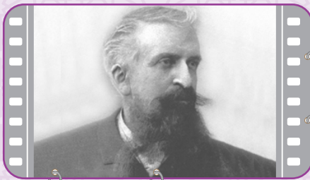
GUSTAVE LE BON 1841-1931