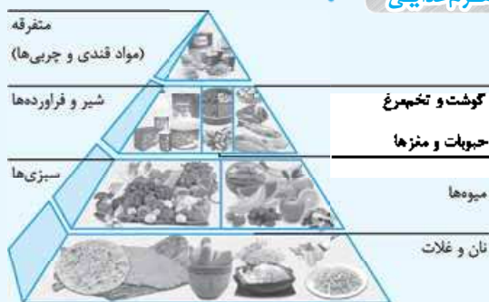
هرم مواد غذایی

توضیح شکل: مواد غذایی که در بالای هرم قرار می‌گیرند، دارای کم‌ترین حجم هستند، به این معنا که افراد باید از این گروه مواد غذایی کم‌تر مصرف کنند (مانند قند و چربی) و هر چه از بالای هرم به سمت پایین حرکت می‌کنیم حجم گروه‌های غذایی بیشتر می‌شود؛ یعنی مقدار مصرف روزانه آن‌ها باید بیشتر باشد.