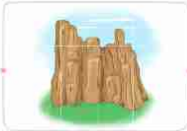
صخره: سنگ سخت