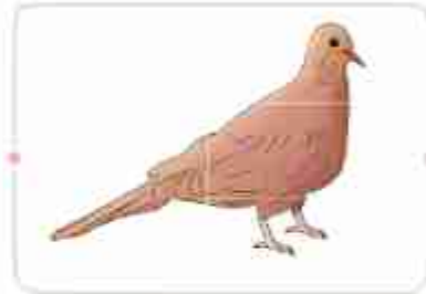
قمری: پرنده‌ای خاکستری رنگ و کوچک‌تر از کبوتر