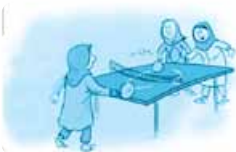
۴- ماذا يَفْعَلُنَّ؟