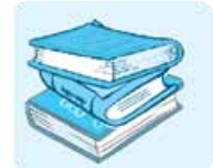
۱- ما هذه؟