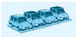
۳- كم سَيَّارَةٌ هُنَا؟