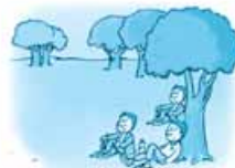
۲- أَيْنَ جَلَسُوا؟