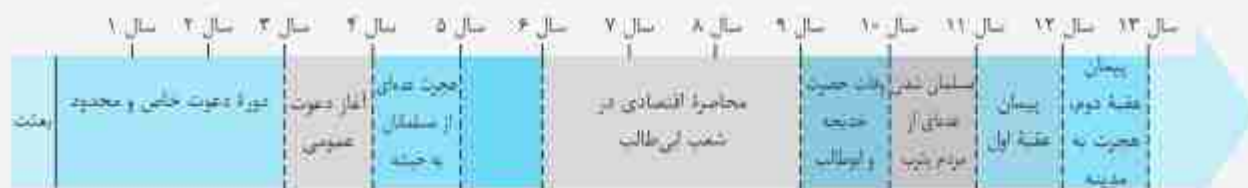
فصلنامه (تکالیف مفروضه) از بعثت تا رحلت