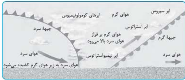
جبهه گرم - جبهه سرد